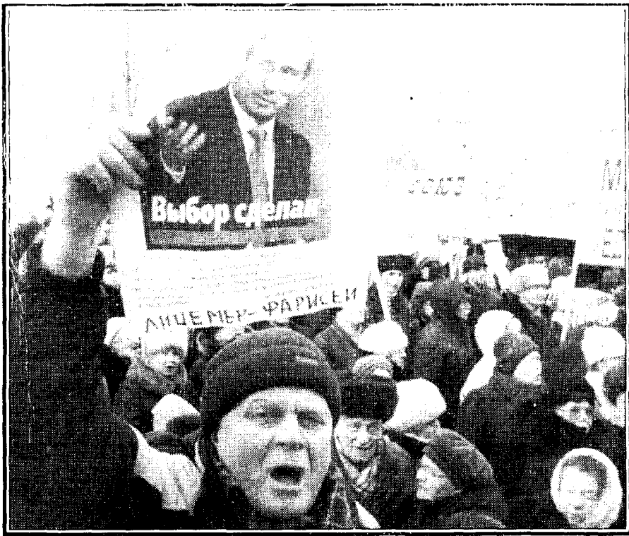
Возмущенный народ реформами В. Путина.