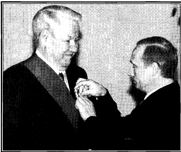
Президент В. Путин награждает орденом за развал Советского Союза Б. Ельцина.