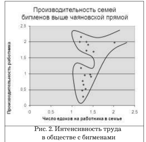
Рис. 2. Интенсивность труда в обществе с бигменами

Излишки продукции, производимой бигменами, накапливаются, а затем раздаются ими для демонстрации своих способностей и увеличения их популярности в обществе. Бигмены излишками своего труда стабилизируют общество, способствуют его росту и защите его членов от разного рода бедствий.