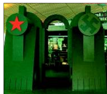
Символ тоталитаризма в эстонском «Музее оккупации»