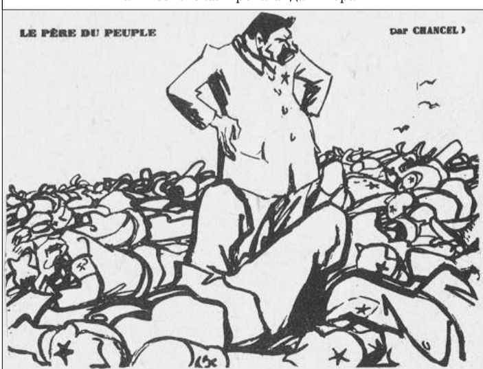
Väterchen Stalin: „Zum Teufel! Die Tscheka mordet gut!“