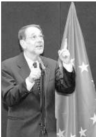
Хавьер Солана не намерен ослаблять внимание к Белоруссии.

Но вернёмся к выборам в Белоруссии. Я не берусь анализировать, действительно ли все эти проценты Лукашенко отданы народом. Однако и литовские наблюдатели, и участники дискуссий в сети Интернет, и журналисты в европейской прессе признают, что Лукашенко пользуется поддержкой не менее 50% населения. Даже оппозиция, выступавшая с протестами, утверждала,