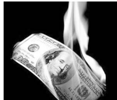
По материалам фильма «Бесценный доллар»